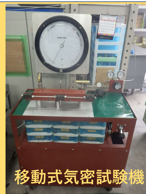
移動式気密試験機